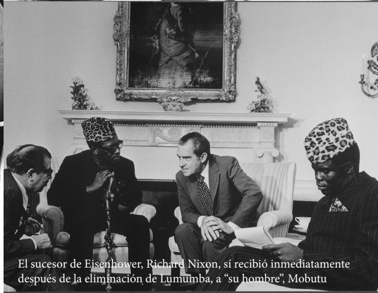
El sucesor de Eisenhower, Richard Nixon, sí recibió inmediatamente después de la eliminación de Lumumba, a "su hombre", Mobutu