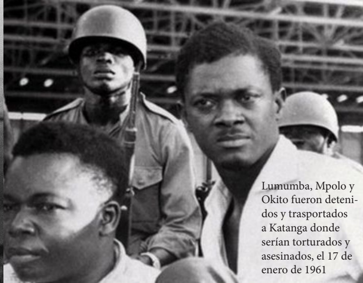
Lumumba, Mpolo y Okito fueron detenidos y transportados a Katanga donde serían torturados y asesinados, el 17 de enero de 1961