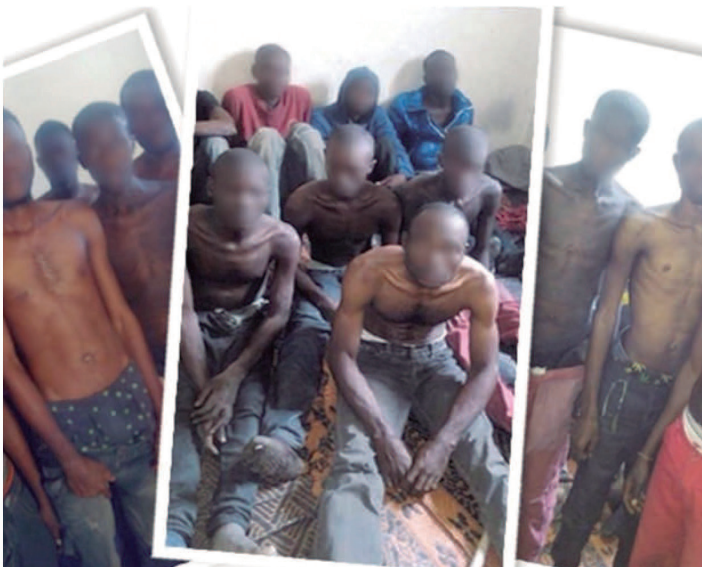
Venta de Inmigrantes esclavizados en Libia

Tras la intervención, Libia ha quedado dividida y enfrentada y se ha implantado también el estado islámico en sus fronteras, reina la guerra entre fracciones y la situación de los DDHH, excusa de la invasión, no puede ser peor con la existencia incluso de la esclavitud, sojuzgamiento de las mujeres y pérdida de todas sus conquistas sociales.