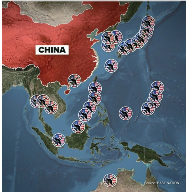
Mapa de las bases yankees Que rodean las costas de China